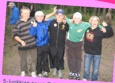
5-luokkien pojat Taitavat Nuoret -leirillä.

Leirillä mukana lasten perheet, Kokkolan 4H, K-P:n Palveluskoirat ry, Merisaukot ry, Partio Lippukunta Halkokariset ja sirkuskoulu